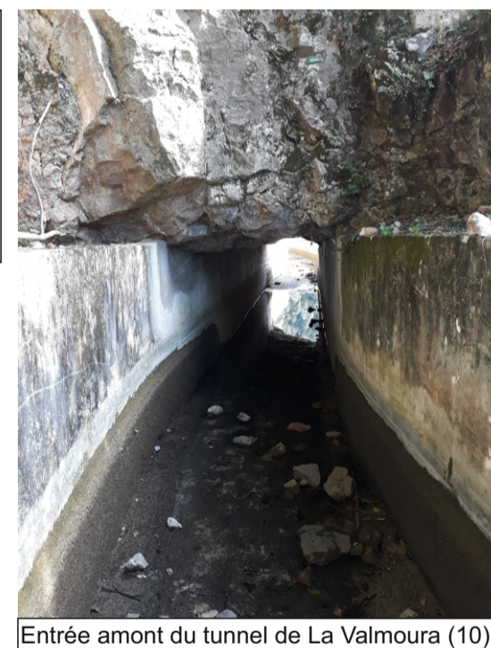
Entrée amont du tunnel de La Valmoura (10)

Tunnel de 13,67 m de long au sud de Saint-Cézaire sur Siagne. Le plafond de ce tunnel est constitué de calcaires et les parois de béton. On note la présence de fractures dans les calcaires (Cf. schémas, photo).