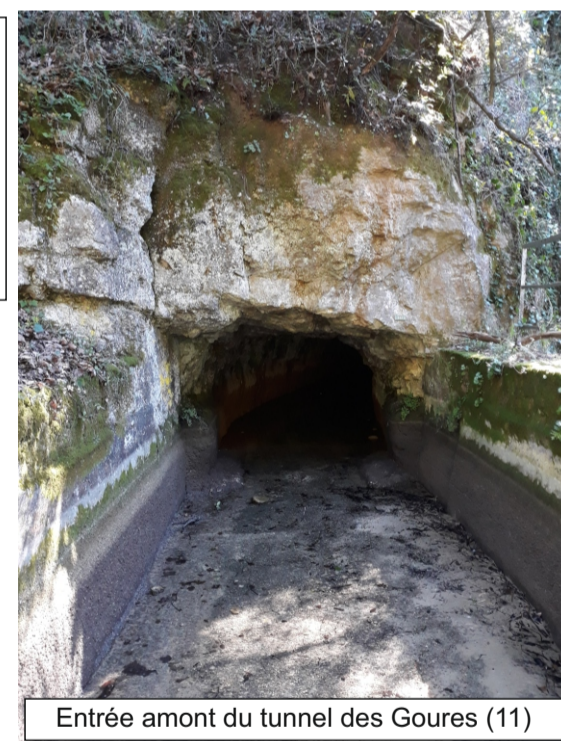
Entrée amont du tunnel des Goures (11)

Tunnel de 49,81 m de long au sud-est de Saint-Cézaire sur Siagne. La voûte de ce tunnel est constitué de calcaires nus. On note la présence de fractures dans les calcaires (Cf. schémas, photo).