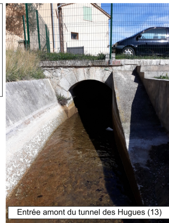
Entrée amont du tunnel des Hugues (13)

Tunnel de 33,57 m de long, à proximité immédiate de maison, sur un terrain privé non bâti. Ce tunnel se situe sur la commune du Tignet dans le versant ouest du vallon du Roure. La voûte de ce tunnels est constituée de pierres maçonnées. (Cf. schémas, photo).