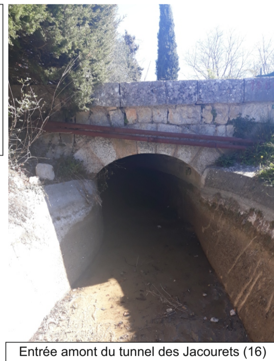
Entrée amont du tunnel des Jacourets (16)

Tunnel de 42,08 m de long au sud de la station de pompage des Jacourets. Ce tunnel se trouve dans des propriétés privées non bâties (au droit du tunnel). La voûte de ce tunnel est constituée de pierres maçonnées (Cf. schémas, photo). Les parois de ce tunnel sont bétonnées.