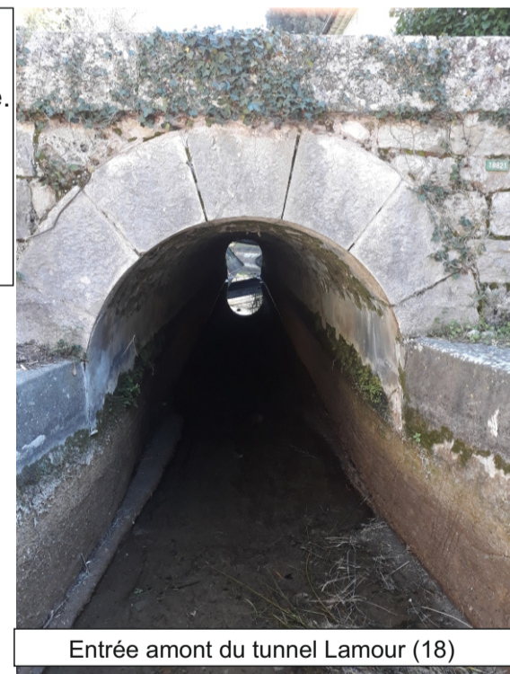
Entrée amont du tunnel Lamour (18)

Tunnel de 20,65 m de long en contrehaut de la route départementale 2562 sur la commune de Grasse. Ce tunnel se trouve à proximité d'une maison, sur une partie de terrain non bâtie (au droit du tunnel). La voûte de ce tunnel est constituée de pierres maçonnées. Les parois de ce tunnel sont bétonnées (Cf. schémas, photo).