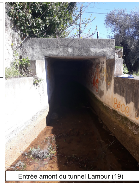
Entrée amont du tunnel Lamour (19)

Tunnel de 39,49 m de long en contrehaut de la route départementale 2562 sur la commune de Grasse. On accède à ce tunnel en empruntant un tronçon en poutrelle hourdis coupé par un pont dont la voûte est constituée de pierres maçonnées. Ce tunnel se trouve dans le tréfonds d'une propriété privée bâtie, sous une partie du terrain non bâtie. La voûte de ce tunnel est constituée de pierres maçonnées. Les pierres de parement aux entrées sont légèrement écartées. Les parois de ce tunnel sont bétonnées (Cf. schémas, photo).