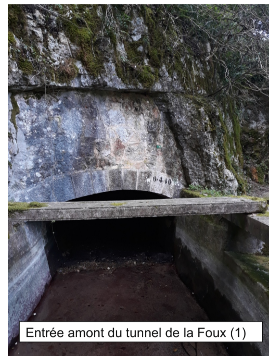
Entrée amont du tunnel de la Foux (1)

Tunnel de 58,82 m de long en contrebas de la route menant à l'usine hydroélectrique. La voûte de ce tunnel est constituée de calcaires fissurés sur laquelle on observe des stalactites (Cf. schémas, photo).