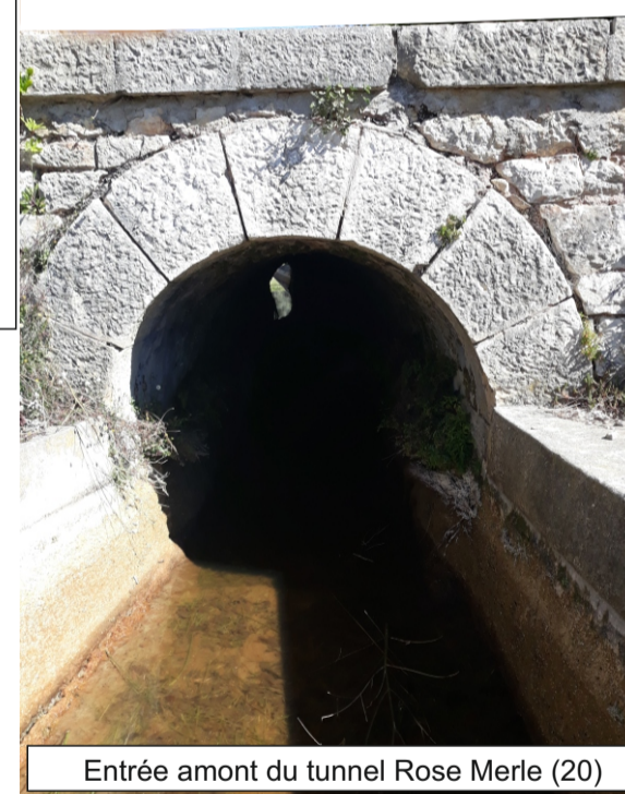
Entrée amont du tunnel Rose Merle (20)

Tunnel de 30,07 m de long en rive droite du vallon des Ribes, sur la commune de Grasse. La voûte de ce tunnel est constituée de pierres maçonnées. Les parois de ce tunnel sont bétonnées (Cf. schémas, photo).