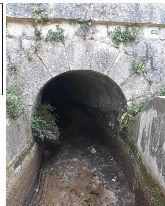
Entrée amont du tunnel du Tignet (23)

Tunnel de 17,14 m de long en rive gauche du vallon des Ribes, sur la commune de Grasse. La voûte de ce tunnel est constituée de pierres maçonnées (Cf. schémas, photo). On note la présence d'une conduite d'assainissement dans la voûte au milieu du tunnel et d'une reprise de la voûte par des poutres bétons au niveau d'un ancien trou.