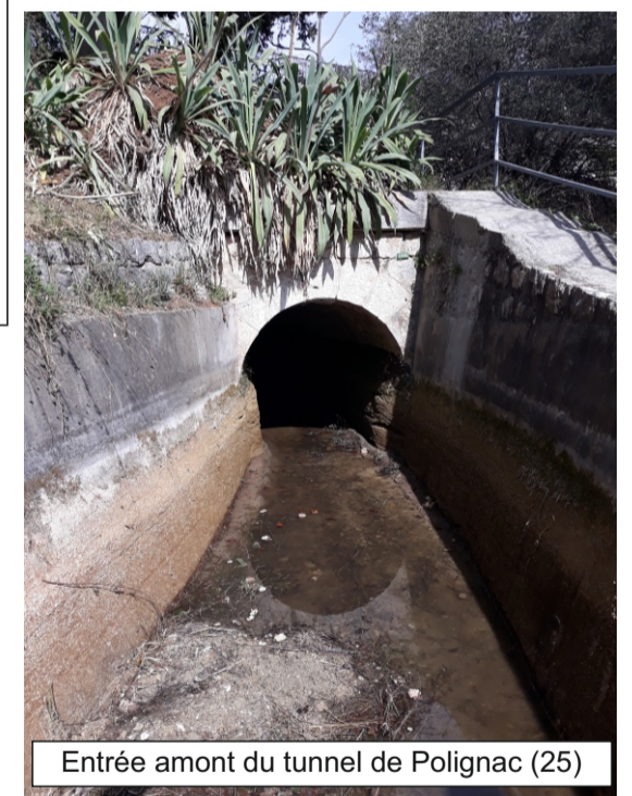
Entrée amont du tunnel de Polignac (25)

Tunnel de 18,30 m de long en contrehaut de la route départementale 2562, sur la commune de Grasse. La voûte de ce tunnel est constituée de pierres maçonnées (Cf. schémas, photo). On observe beaucoup de concrétions sur les parois du tunnel.