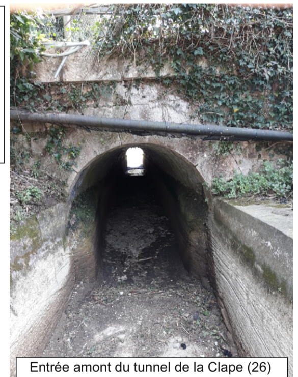
Entrée amont du tunnel de la Clape (26)

Tunnel de 23,42 m de long en contrehaut de la route départementale 2562, sur la commune de Grasse. La voûte de ce tunnel est constituée de pierres maçonnées (Cf. schémas, photo). On observe beaucoup de concrétions sur les parois du tunnel.