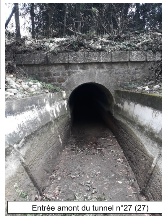
Entrée amont du tunnel n°27 (27)

Tunnel de 35,71 m de long passant sous la route départementale 2562, sur la commune de Grasse. La voûte de ce tunnel est constituée de pierres maçonnées et d'un petit passage bétonné avec IPN au milieu du tunnel (Cf. schémas, photo). Le tunnel se termine sur une section en dalot.