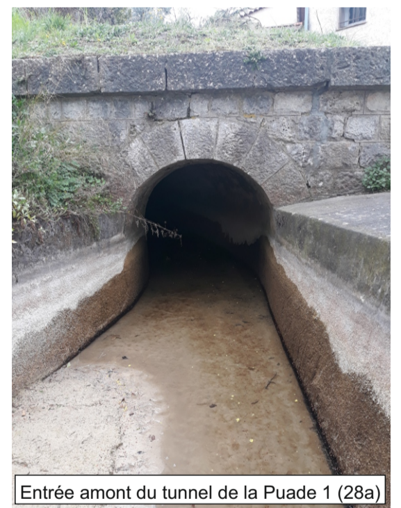
Entrée amont du tunnel de la Puade 1 (28a)

Tunnel de 31,37 m de long passant sous une propriété privée bâtie, lieu-dit les Loubonnières, commune de Grasse. Le tunnel doit passer à proximité immédiate du bâti. La voûte de ce tunnel est constituée de pierres maçonnées (Cf. schémas, photo).